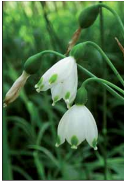
A tanösvény névadója, a tőzike