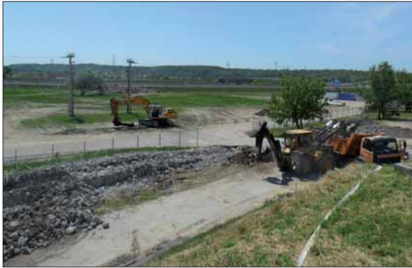
Épül a tisztítómű

A KDB 2011. május 10-én hozott végzésével megszüntette a jogorvoslati eljárást. Jelenleg tehát