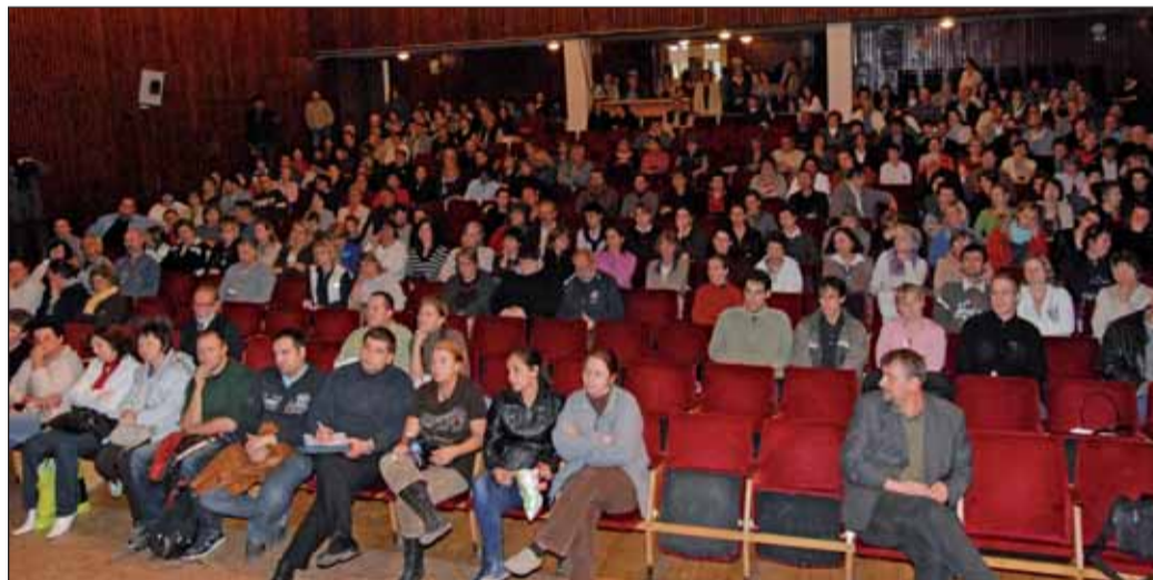
A művelődési központban rendezett fórum közönsége

lását idézem, amely szerint nem ró aránytalan terhet sem a tanulókra, sem a szülőkre, továbbra is megfelelő színvonalat biztosít az oktatáshoz, elhárítja a hátrányos megkülönböztetés veszélyét, és korszerűbb, gazdaságosabb körülményeket biztosít a diákok számára. Azt hiszem, ez elég egyértelmű állásfoglalás. A távolság: összesen alig több mint egy kilométerről van szó... Ami pedig a biztonságot illeti, mert az is nagyon fontos, talán a legfontosabb kérdés: már tervezzük a Balatoni út érintett szakaszának biztonságosabbá tételét, gyalogátkelőhely létesítését.