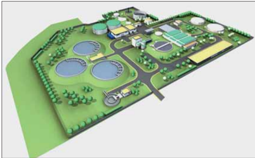
A kibővülő szennyvíztisztító látványterve

nincs akadálya az értékelésnek. A tervezett eredményhirdetés dátuma: 2011. június 1.