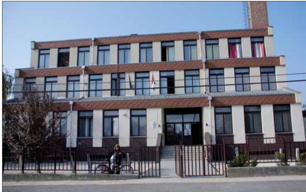
A Hunyadi Mátyás Általános Iskola épülete

– Az aránytalan teher kérdésében ismét Oktatási Hivatal által kijelölt szakértő állásfoga-